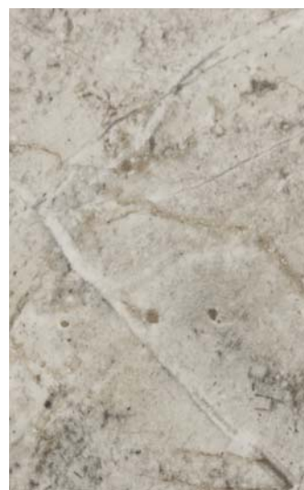
5643 TOUCH SCALA MARBLE 3050x1300x12mm

при заказе цвет в полиграфическом исполнении требует обязательного сопоставления с оригиналом (из-за возможных отклонений при печати)