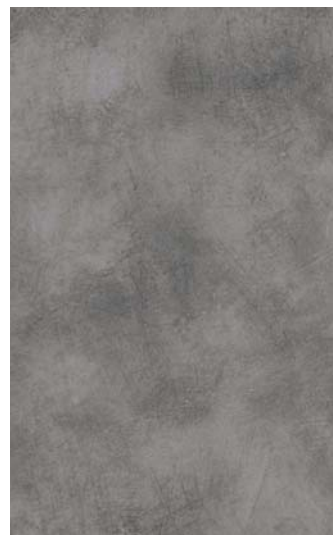
5648 COPPERFIELD VELUR (BLACK CORE) 3050x1300x12mm