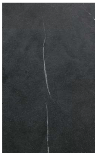
5666 TOUCH GRAY MARBLE 3050x1300x12mm