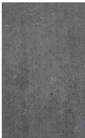
5677 EVEREST FERRO 4200x1400x12mm