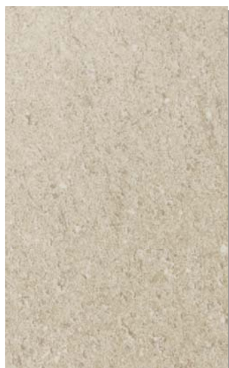
5634 TOUCH BAZALT KREM 3050x1300x12mm