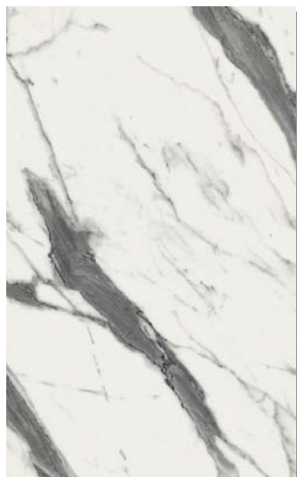
5657 AFYON MARBL VELUR (BLACK CORE) 3050x1300x12mm